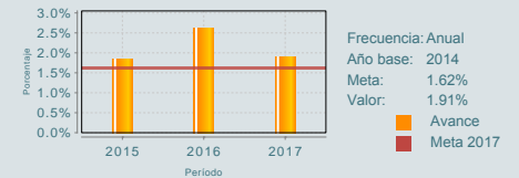
Porcentaje de personas adultas mayores que hacen uso de los servicios que brinda el programa

El Programa no cuenta con evaluaciones de impacto que den cuenta de los resultados netos atribuibles a su intervención en su PA. En 2012 se realizó la "Evaluación Complementaria de Diseño, Consistencia y Medición de Resultados (2010-2011) del Programa Servicios a Grupos con Necesidades Especiales (E003)"; no obstante, debido a que cuenta con una antigüedad de 6 años, se considera que los resultados obtenidos en aquél momento podrían no ser válidos en la actualidad. Se reitera la necesidad de plantear indicadores de resultados más robustos a nivel de Propósito en la Matriz de Indicadores para Resultados (MIR), puesto que por ejemplo el indicador "porcentaje de personas adultas mayores que hacen uso de los servicios que brinda el programa", que señala las PAM a las que les fueron otorgados servicios, falla en dar cuenta de los resultados logrados sobre esta población a partir de la intervención del Programa. Asimismo, las actuales metas de los indicadores de la MIR no se definieron atendiendo lo señalado en el documento denominado "Metodología para la programación de metas del Programa E003, Servicios a grupos con necesidades especiales a cargo del Inapam", por lo que se considera que son demasiado laxas.